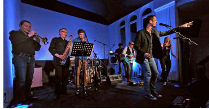
Veranstaltungsorte „Gütersloher Sommer“